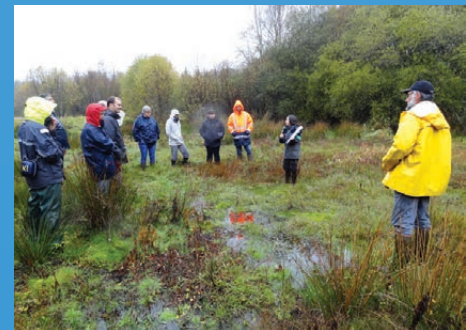
La réserve naturelle régionale de Magoar-Penvern à Glomel

* AMV : Association de Mise en Valeur des sites naturels de Glomel