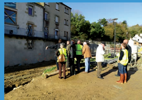
Les travaux de confortement des berges de l'Isolle en basse-ville de Quimperlé