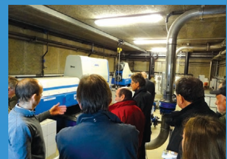
La nouvelle STEP de Clohars-Carnoët